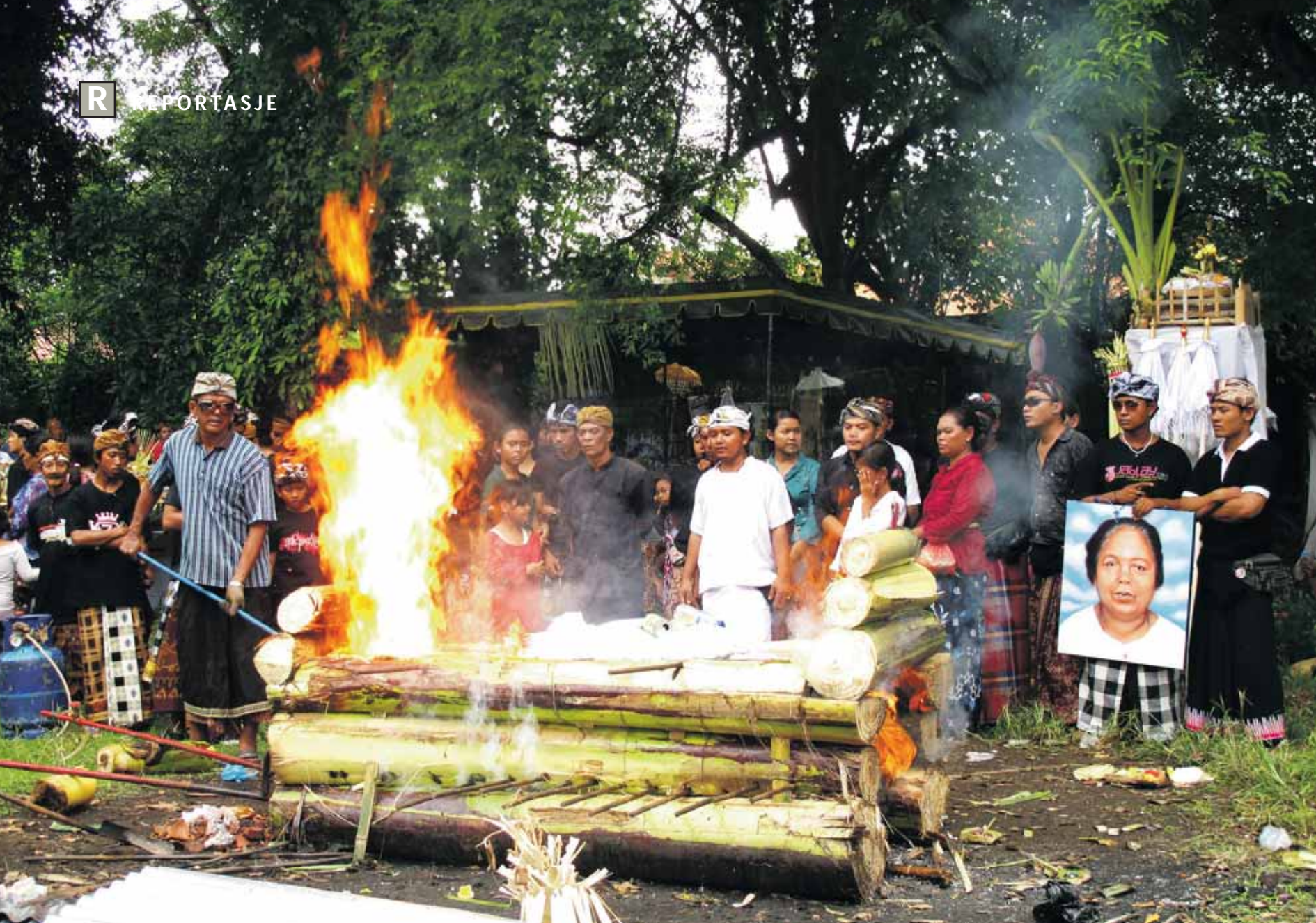
Kremasjonsseremoni: På grunn av de store kostnadene er den avdøde ofte midlertidig begravd i opptil flere år før kremasjonsseremonien avholdes.