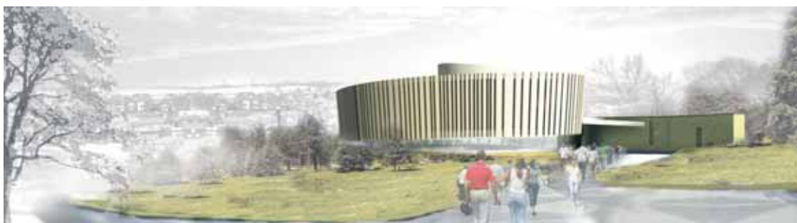
Slik tenker IHUGA arkitekter seg at seremonilokale kan framstå på utsiden.