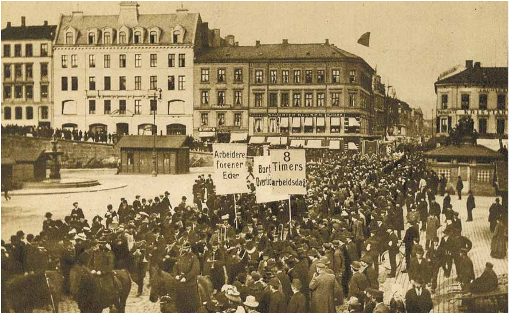
Stifterne av fritenkerforeningen utgikk fra den sosialistiske ungdomsbevegelsen, og deltok sannsynligvis i dette 1. mai-toget i 1908.