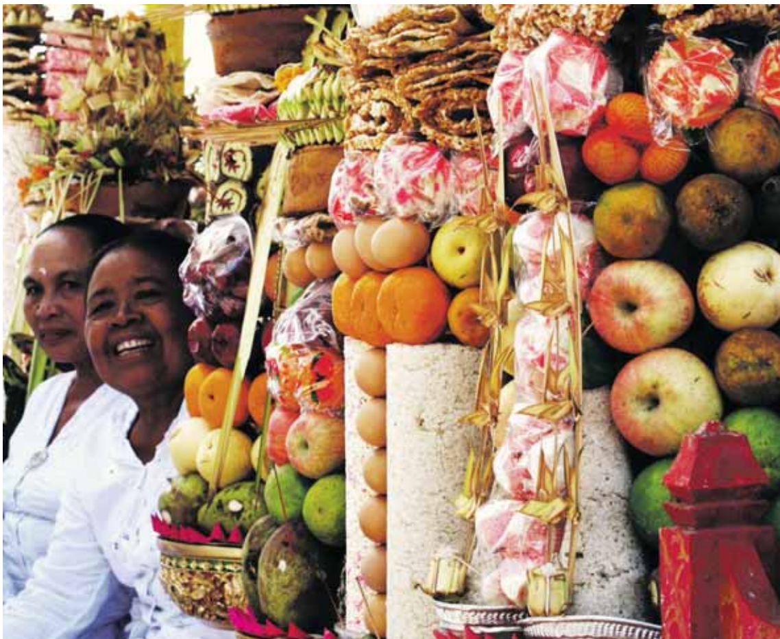
Tempelbursdag: Tempelet har bursdag, og folk fra omkringliggende landsbyer har kommet og brakt med seg forseggjorte ofringer.

– Når en ulykke skjer, er det en årsak til det. Det betyr at man har gjort noe galt. Balinesere forklarer aldri hendelser med tilfeldigheter, sier Lieungh.